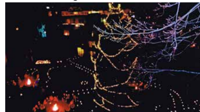
Der leuchtende Baum 2016

Dienstag, 12.12., 17 Uhr Glühwein am Weihnachtsbaum Wir treffen uns im Garten an der Feuerschale, trinken Glühwein und erfreuen uns an der festlich geschmückten Tanne.